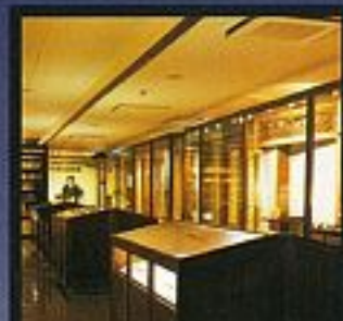
展示龍馬相關資料的「有緣資料館」