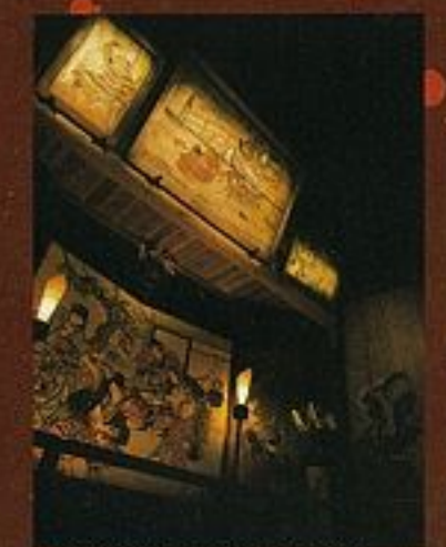
其他還有無與倫比的畫風