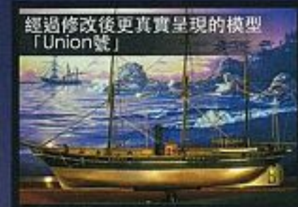
經過修改後更真實呈現的模型「Union號」

用蠟像再次呈現，生於土佐的幕末英雄，坂本龍馬的激烈人生，是世界唯一的展示館。 栩栩如生的等身蠟像，彷彿暫停了歷史的瞬間，讓我們感受『龍馬精神』。