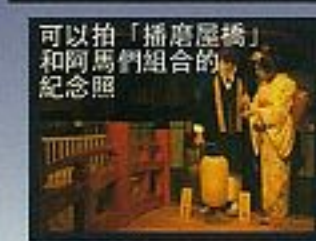
可以拍「播磨屋敷」和龍馬們組合的紀念照