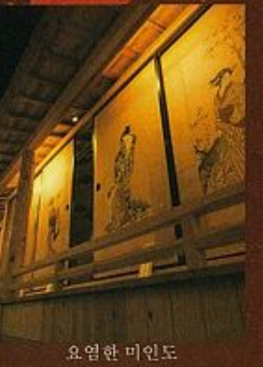
다른 이에게서는 볼 수 없는 화풍