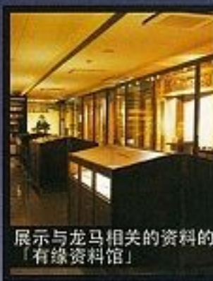
展示与龙马相关的资料的「有缘资料馆」