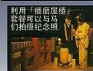
利用「桥梁摄影」套餐可以与马们拍摄纪念照