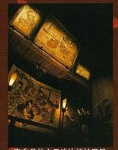
实在是他人无法比拟的画风